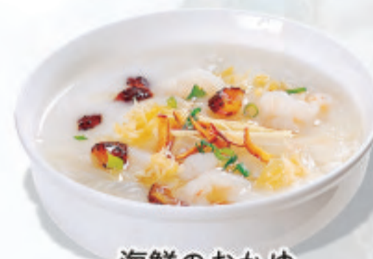
海鮮のおかゆ 海鮮粥 Seafood Congee ¥1,800