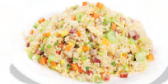
レタスと叉焼のチャーハン 生菜叉烧炒饭 Braised Fried Rice with Lettuce ¥1,380