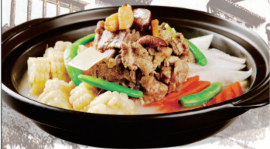
貝柱とイカとエビの鍋 (塩味) 三鲜煲 Three Fresh Pots ¥2,500

颇 | 受 | 食 | 客 | 的 | 青 | 睐 Popular with diners 肉质细嫩，味感浓郁