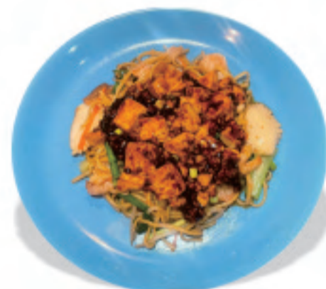
麻婆焼きそば 麻婆炒面 Mapo Fried Noodles ¥1,800