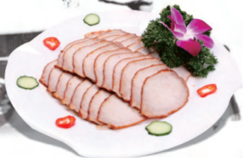
香港樓風チャーシュー 港式叉燒 Hong Kong style barbecue ¥1,650