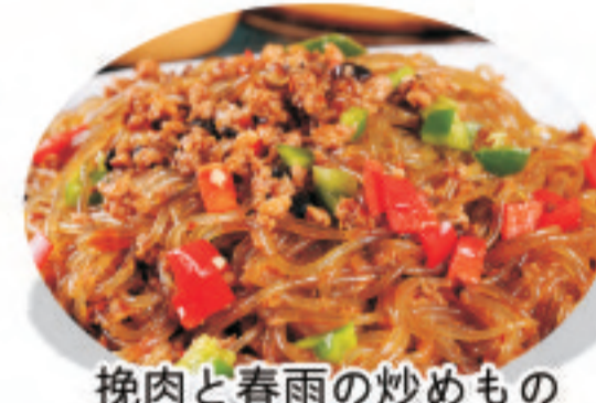
挽肉と春雨の炒めもの 蚂蚁上树 Ants climb trees ¥1,800