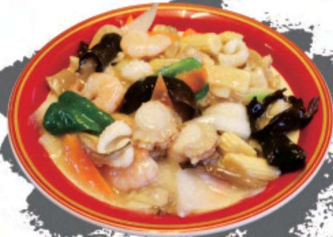
海鮮八宝菜 海鮮八宝菜 Seafood Babao Cai ¥2,000