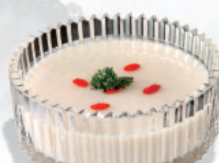
杏仁豆腐 ¥680 杏仁豆腐 Almond curd

※表示価格は税込価格です！ ※写真はイメージで、分量など実際と異なる場合があります *表示价格为含税价格 *菜品图片仅供点菜参考，出品以实物为准。