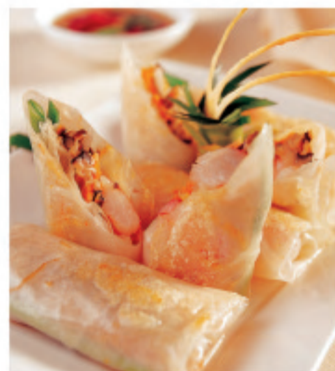
ベトナム風生吞巻き 越南风生春卷 Vietnam Spring rolls ¥1,500