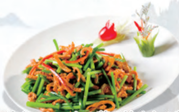
豚肉とニンニクの芽の炒めもの蒜 蒜苔炒肉丝 Stir fried shredded pork with garlic sprouts ¥1,650