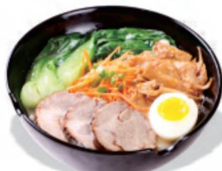
チャーシュー麺 叉烧面 Barbecued Noodles ¥1,380