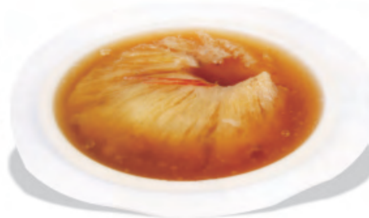
フカヒレの姿煮 红烧大排翅 Braised Shark's Fin in Brown Sauce ¥6,000