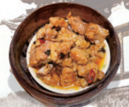
蒸しスペアリブ 豆豉蒸排骨 Steamed Spareribs with Black Bean Sauce ¥1,280