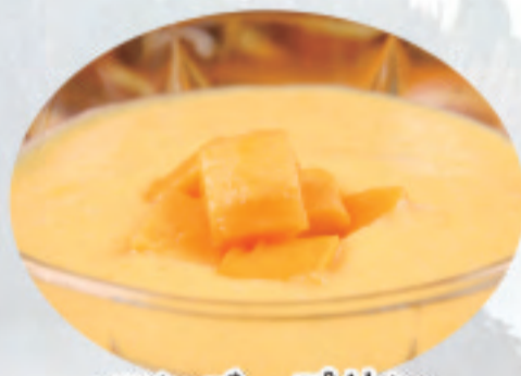
マンゴープリン 芒果布丁 Mango pudding ¥680