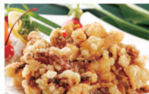
イカの揚げもの 炸鱿鱼 Calamari ¥1,800