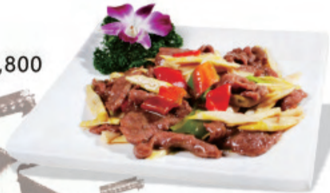
和牛とアスパラの炒めもの ¥2,800 和牛炒芦筍 Stir fried asparagus with beef