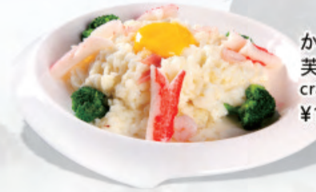
かにたま 芙蓉蟹 crab foo yung ¥1,500