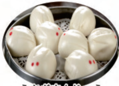
うさぎまんじゅう 小兔包 Bunny bun ¥980