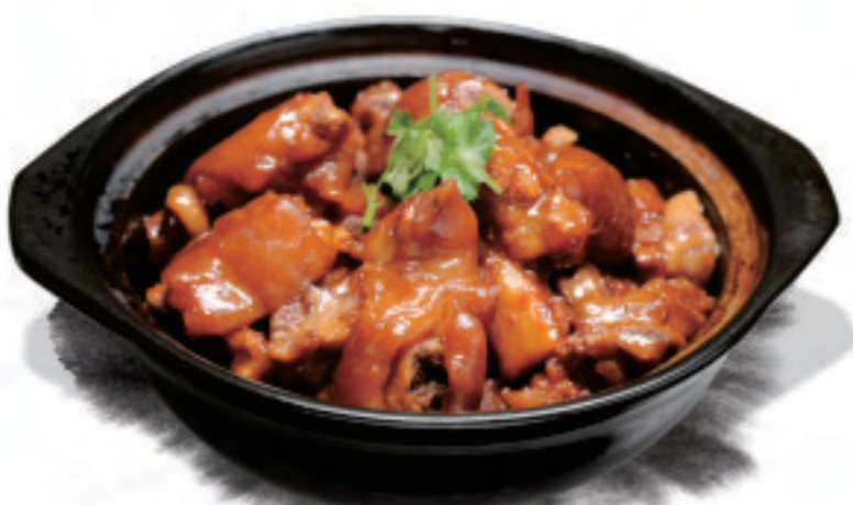
豚足の醤油煮込み 红烧猪蹄 Braised Pig Feet in Brown Sauce ¥2,000