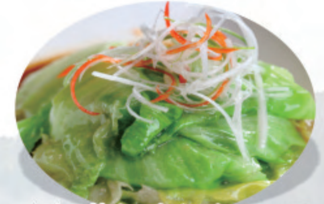
レタス炒め・オイスターソース 蠔油生菜 Oyster sauce lettuce ¥1,800