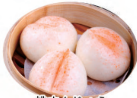
桃まんじゅう 寿桃包 Shou Tao Bao ¥1,380