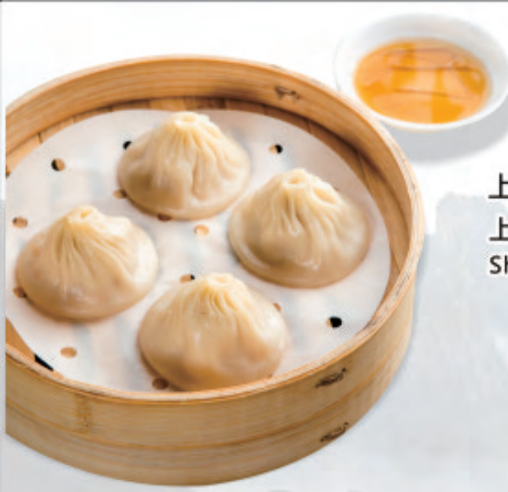
上海小籠包 ¥980 上海小笼包 Shanghai Xiaolongbao