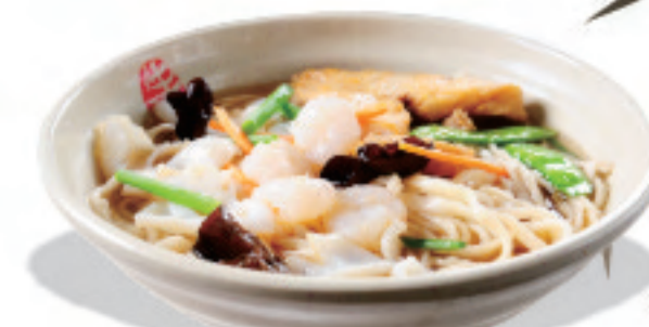
海鮮五目ラーメン 海鮮汤面 Seafood Noodles in soup ¥1,380