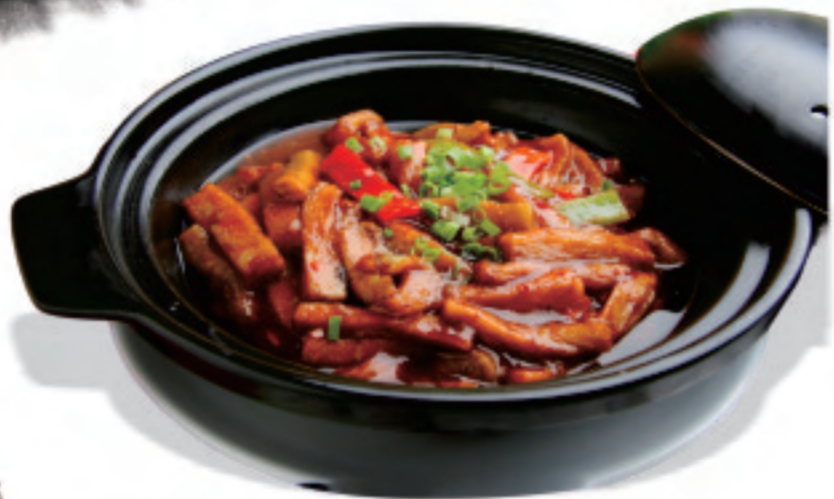
茄子のピリ辛煮込み 鱼香茄子煲 Fish Flavored Eggplant Pot ¥1,800