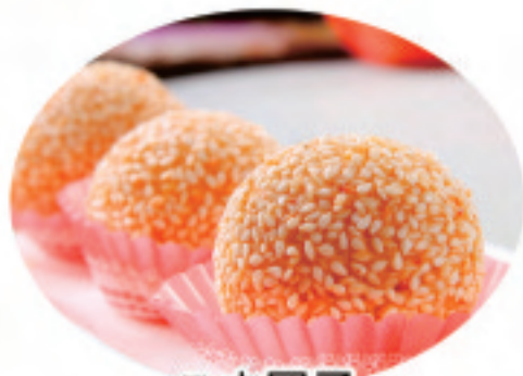
こま団子 芝麻球 Glutinous rice sesame balls ¥980