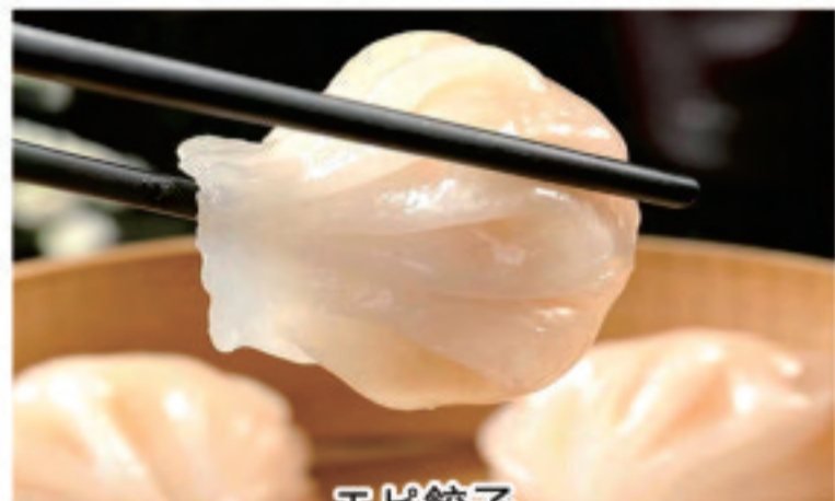
エビ餃子 虾饺 shrimp ravioli ¥980