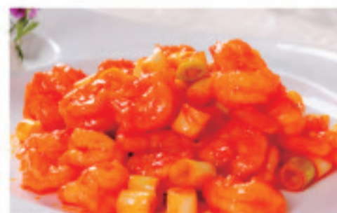
エビのチリソース 红烧虾仁 Braised Shrimp in Brown Sauce ¥2,000