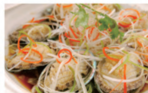
あわびのオイスターソース 蠔油鲍鱼 Abalone in oyster sauce ¥3,000