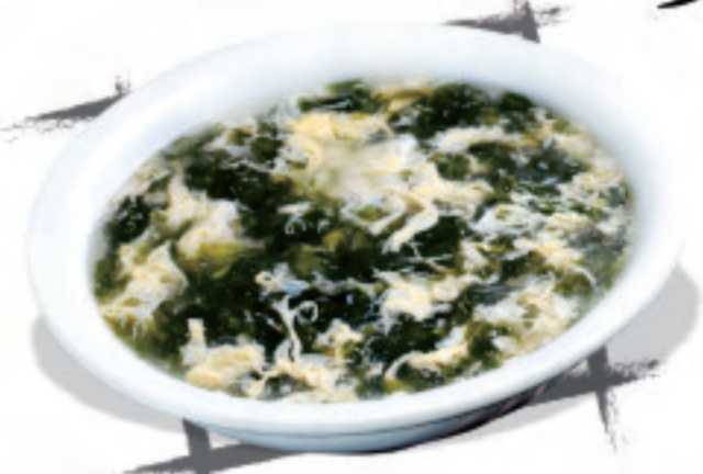
きのこ卵のスープ ¥1,500 素蛋汤 Vegetarian egg soup