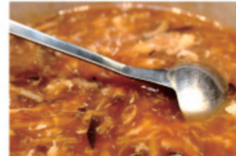
アワビとフカヒレのスープ 鲍鱼三丝羹 Abalone Three Shredded Soup ¥1,980