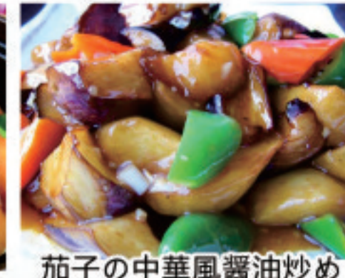
茄子の中華風醤油炒め 红烧茄子 Braised Eggplant in Brown Sauce ¥1,650