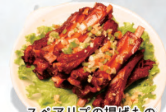
スペアリブの揚げもの 椒盐排骨 Spicy and Salted Spareribs ¥2,000