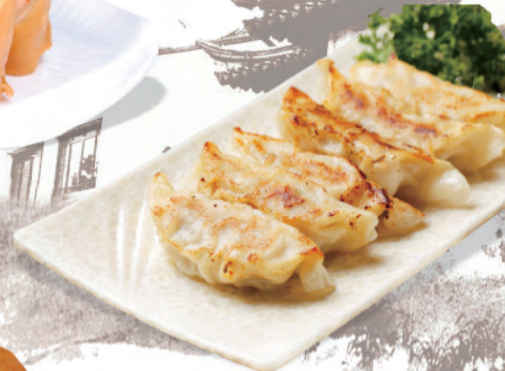
特製焼き餃子 ¥880 港式煎餃 Hong Kong style fried dumplings