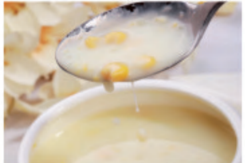
コーンスープ 玉米汤 Corn soup ¥1,500