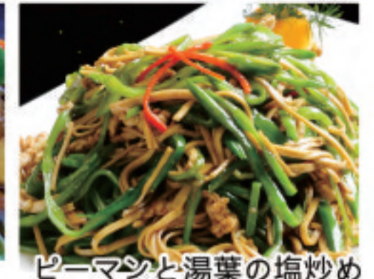
ピーマンと湯葉の塩炒め 港式青椒干豆腐丝 Hong Kong style dried tofu shreds with green pepper ¥1,500