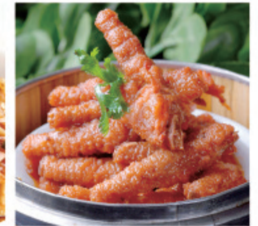
鶏の脚の蒸しもの 港式豉汁蒸凤爪 Hong Kong style steamed chicken feet with soy sauce ¥1,080

※表示価格は税込価格です！ ※写真はイメージで、分量など実際と異なる場合があります。 *表示价格为含税价格 *菜品图片仅供点菜参考，出品以实物为准。