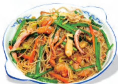
香港樓風ピーフン炒め 港式炒米粉 Hong Kong style Fried rice noodles ¥1,500