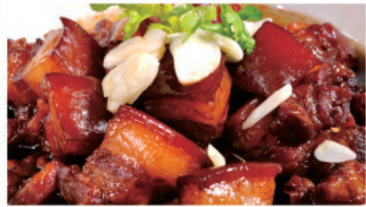
豚バラ肉の煮込み 红烧五花肉 Braised Pork Belly ¥2,500