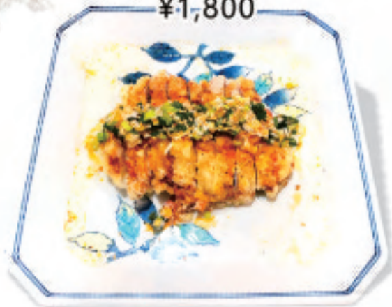
鶏の揚げ物・ネギ醤油たれ仕立て 油淋鸡 oil-dripped chicken ¥1,800