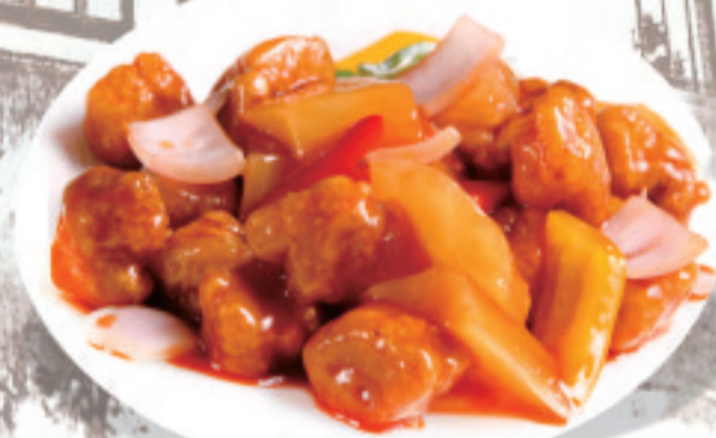
黒酢酢豚 咕咾肉 Sweet and sour pork ¥1,800