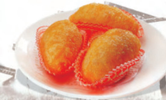
もち米の揚げ餃子 咸水饺 Salty Dumplings ¥980