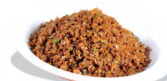
XO醬チャーハン XO醬炒饭 Fried Rice with XO Sauce ¥1,380