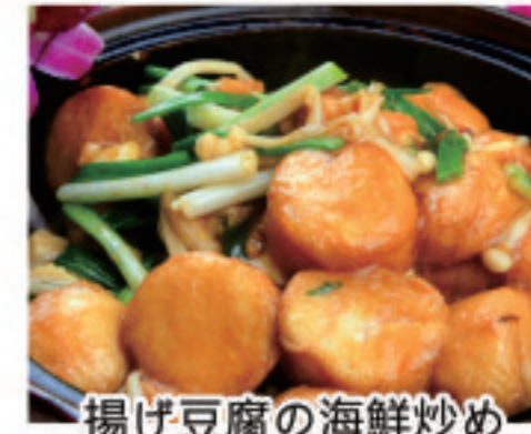
揚げ豆腐の海鮮炒め 海鮮豆腐 Seafood Tofu ¥2,000