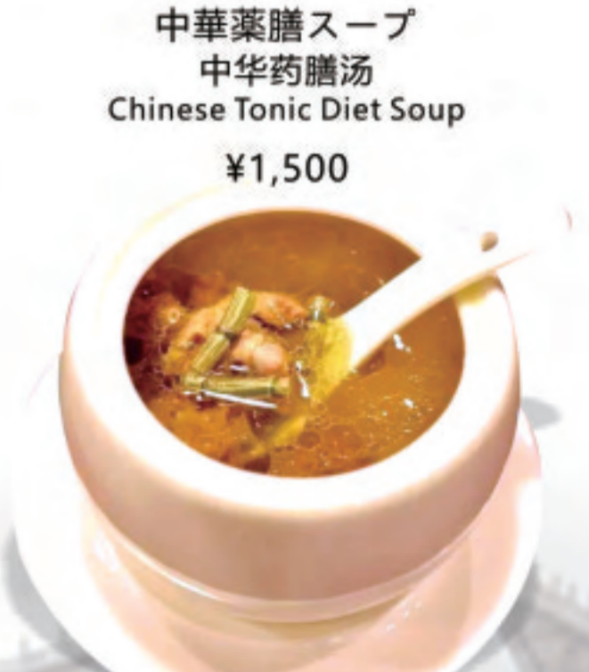
中華薬膳スープ 中华药膳汤 Chinese Tonic Diet Soup ¥1,500

※表示価格は税込価格です！ ※写真はイメージで、分量など実際と異なる場合があります *表示价格为含税价格 *菜品图片仅供点菜参考，出品以实物为准。