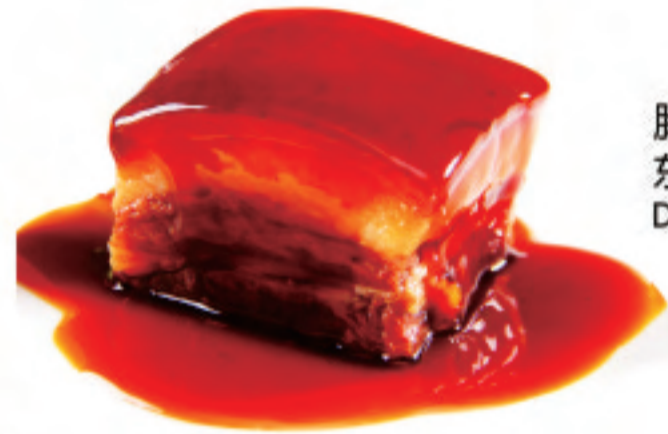
豚の角煮 ¥2,000 东坡肉 Dongpo Braised Pork