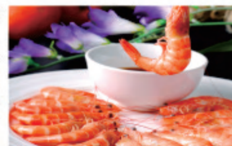
新鮮エビ 活虾 Live shrimp 時價