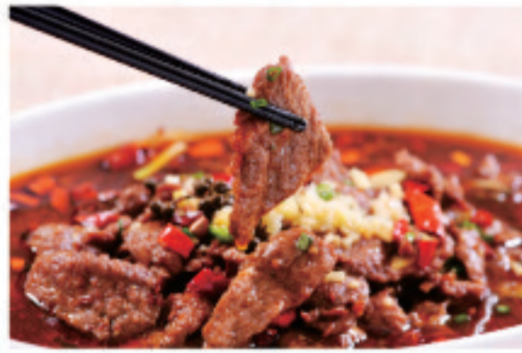
牛肉のピリ辛煮込み 水煮牛肉 Boiled beef in water ¥2,180