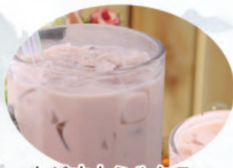
タピオカミルクティ 珍珠奶茶 Pearl milk tea ¥680