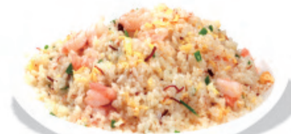
えびチャーハン 虾仁炒饭 Shrimp Fried Rice ¥1,380