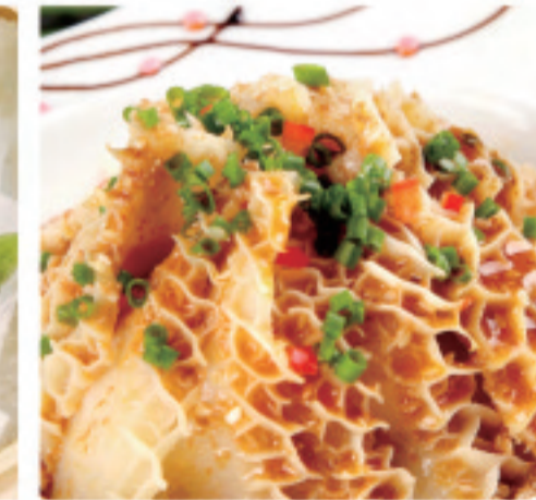
牛ハチノスの黒豆ソース 蒸牛肚 Steamed Beef Tripe ¥1,280