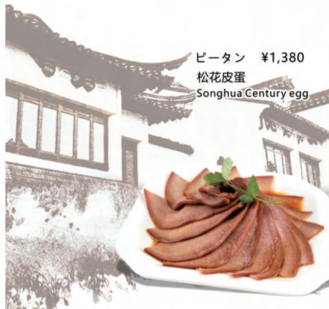
ピータン ¥1,380 松花皮蛋 Songhua Century egg