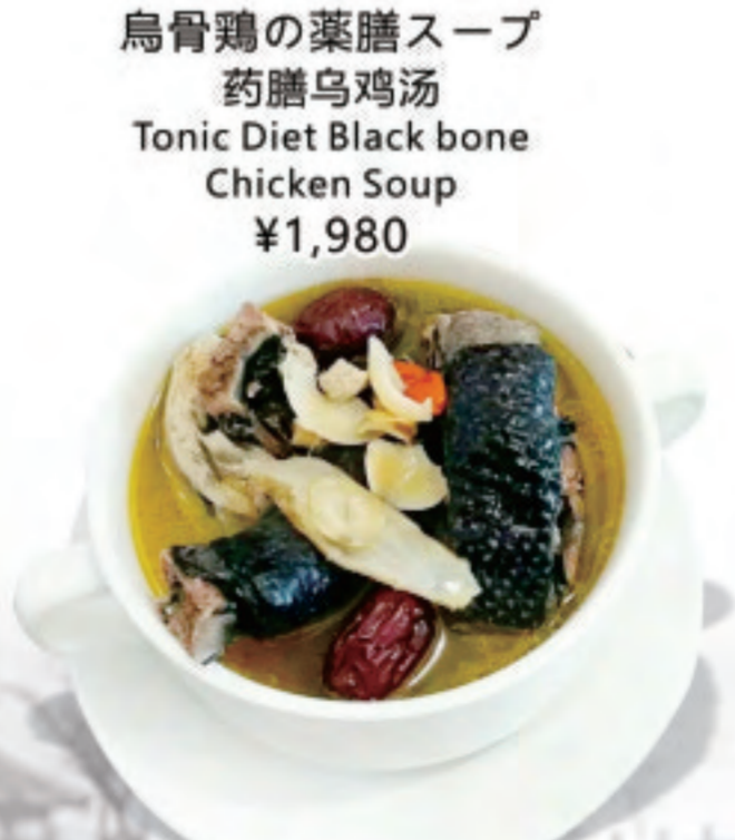
烏骨鶏の薬膳スープ 药膳乌鸡汤 Tonic Diet Black bone Chicken Soup ¥1,980