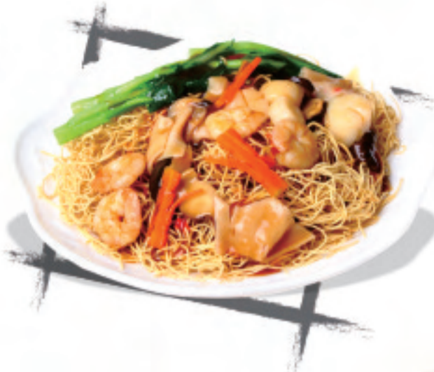
上海風揚げそば ¥1,500 上海风炸面 Shanghai style fried noodles