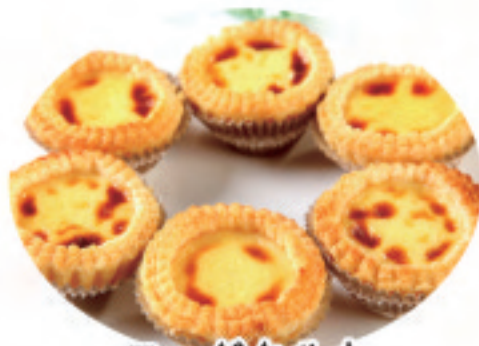
エッグタルト 蛋挞 Egg tarts ¥980