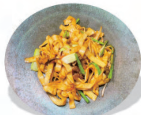
広東風きしめんと肉野菜炒め 广式炒河粉 Hong Kong style fried river noodles ¥1,500