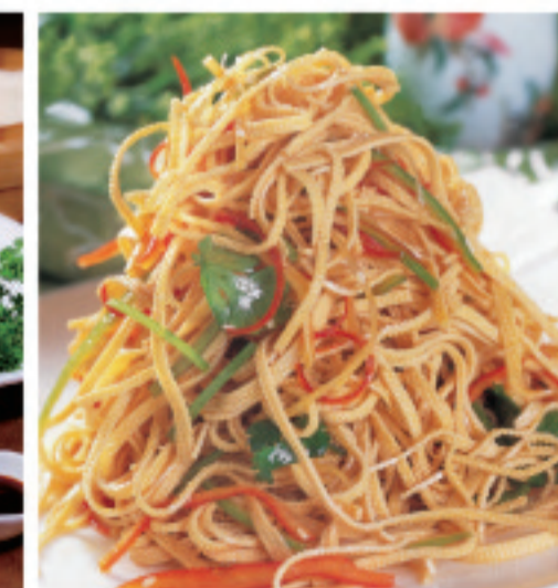
細切り湯葉の和えもの 凉拌干豆腐丝 Cold Mixed Dried Tofu Shredded ¥1,380