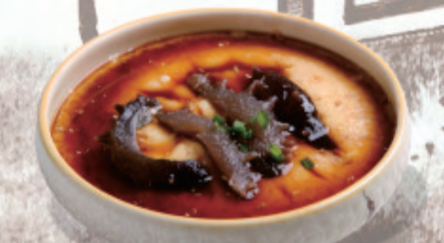
干し北海道産海鼠茶碗蒸し 北海道产干海参蒸蛋(只) Hokkaido Dried Sea Cucumber (piece) 時價