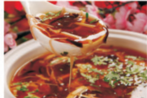
サンラータン 酸辣汤 Hot and sour soup ¥1,800