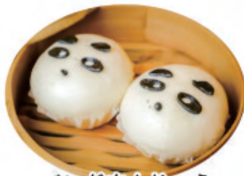
パンダまんじゅう 熊猫包 Panda bag ¥1,000