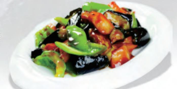
大地の恵み三種炒め ¥1,500 地三鲜 Ground three fresh vegetables