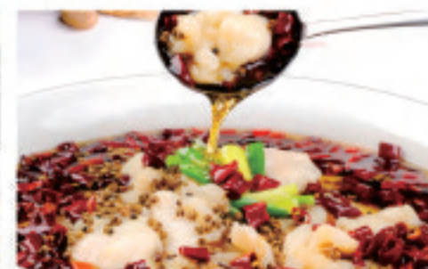
シュイチュウ 水煮魚 Boiled Fish in Water ¥3,800

※表示価格は税込価格です! ※写真はイメージで、分量など実際と異なる場合があります *表示价格为含税价格 *菜品图片仅供点菜参考, 出品以实物为准。