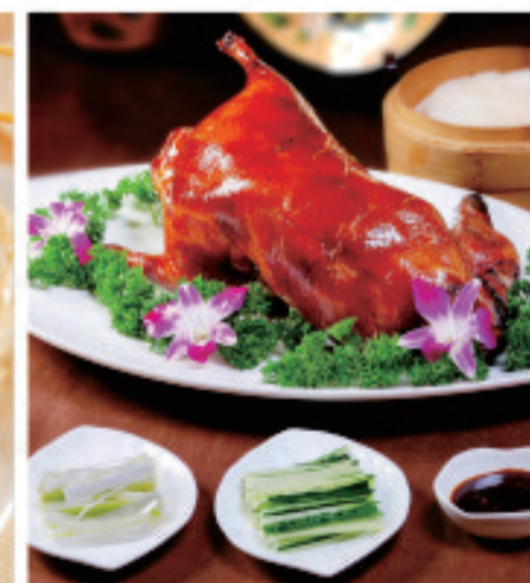
北京ダック 北京烤鸭 Beijing Roast Duck ¥2,000