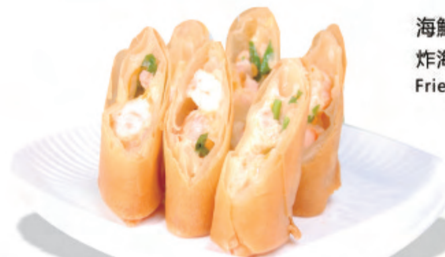
海鮮プリプリ春巻き炸 ¥1,080 炸海鮮春卷 Fried seafood Spring rolls