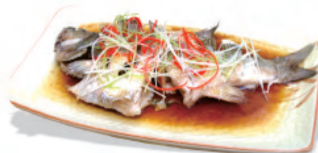
チンジャンユ 清蒸活鱼 Steamed live fish 時價