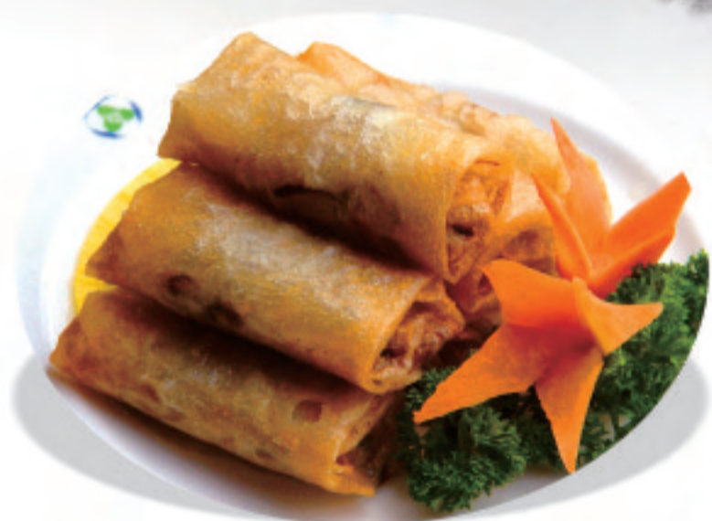
野菜入り春巻き ¥980 炸春卷 Fried Spring rolls