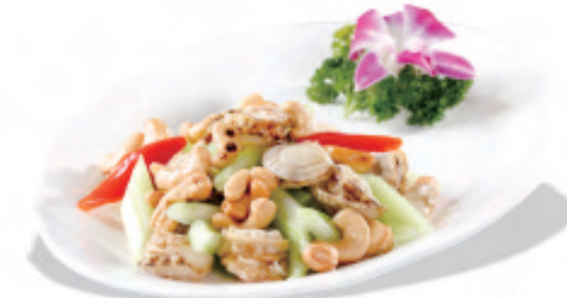
貝柱の炒めもの黒豆ソース 黑豆豉炒鲜贝 Fried Fresh Scallops with Black Bean Sauce ¥2,000