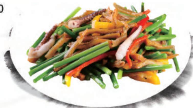
海鮮野菜炒め ¥1,980 野菜炒鱿鱼 Fried Squid with Wild Vegetables