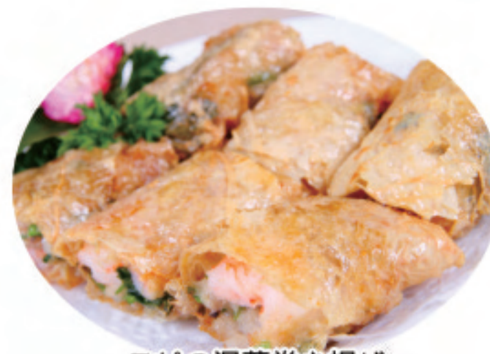
エビの湯葉巻き揚げ 炸腐皮卷 Fried Shredded Skin Rolls ¥1,080