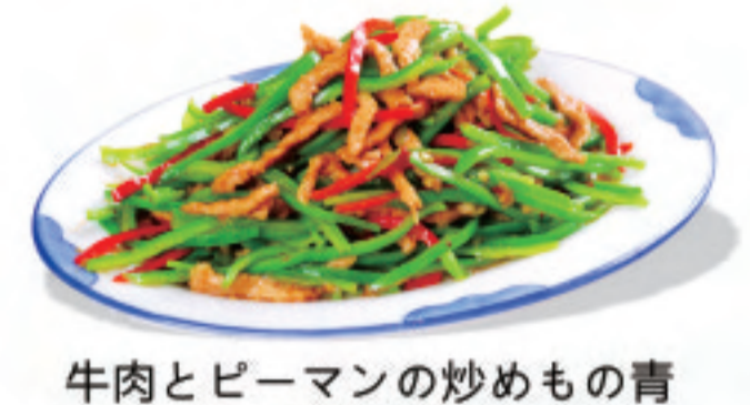
牛肉とピーマンの炒めもの青 青椒肉丝 Shredded pork and green pepper ¥2,000