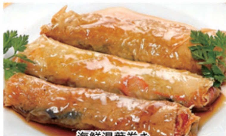
海鮮湯葉巻き 海鮮腐皮卷 Seafood Preserved Skin Rolls ¥1,080