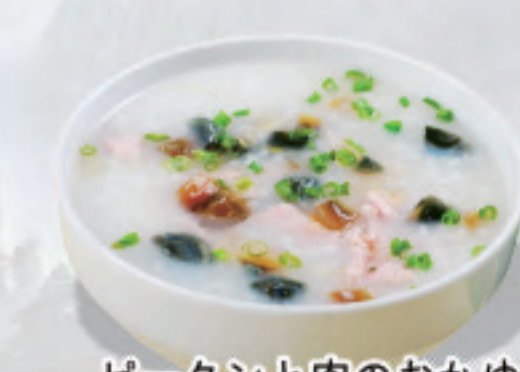
ピータンと肉のおかゆ 皮蛋瘦肉粥 Century egg and Lean Pork Congee ¥1,500

※表示価格は税込価格です! ※写真はイメージで、分量など実際と異なる場合があります *表示价格为含税价格 *菜品图片仅供点菜参考, 出品以实物为准。