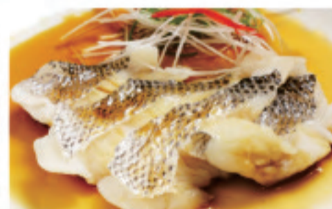
魚の蒸しもの 蒸鱼 Steamed fish ¥2,000