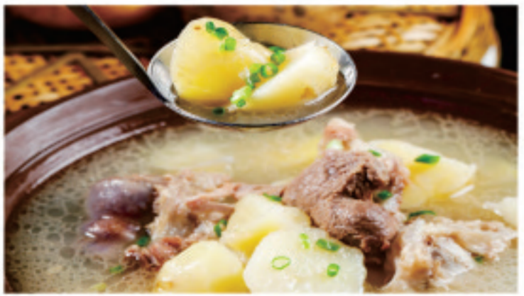
じゃがいもとスペアリブの煮込み (塩味) 土豆排骨煲 Potato Ribs Casserole ¥2,750

颇 | 受 | 食 | 客 | 的 | 青 | 睐 Popular with diners 肉质细嫩，味感浓郁