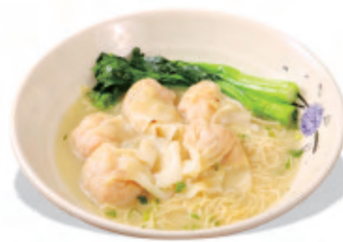
ワンタン麺 (ワンタン3ヶ) 云吞面 Wonton noodles ¥1,380