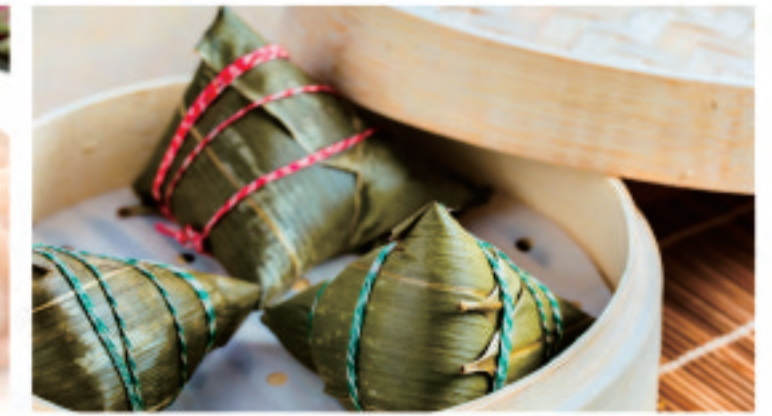
肉ちまき 肉粽 glutinous rice dumpling filled with meat ¥980