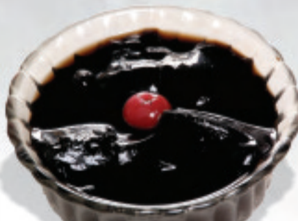
亀ゼリー ¥780 龟令膏 Guiling ointment