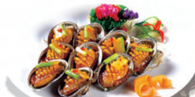
アワビ (匹) 活鲍鱼(只) Live Abalone (piece) 時價