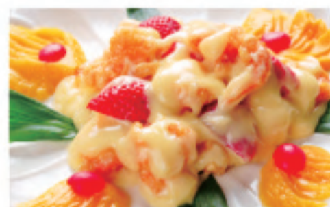
エヒマヨ 奶油虾仁 Cream of Shrimp ¥2,000