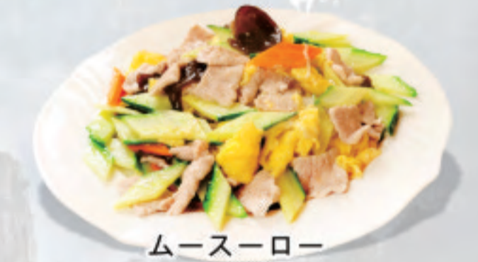
ムースーロー 木須肉 Wood Whisker Meat ¥1,980