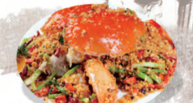
ズワイガニの香り揚げ(四名から) 避风塘大蟹 Typhoon Shelter Crab ¥5,800