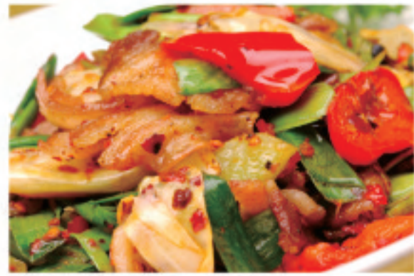
豚肉とキャベツの味噌炒め 回锅肉 Twice cooked pork ¥1,800