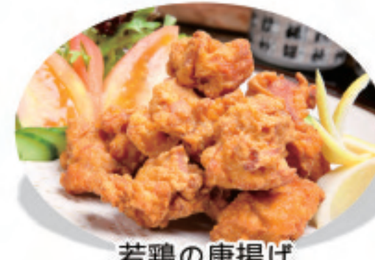
若鶏の唐揚げ 炸子鸡 Crispy fried chicken ¥1,500