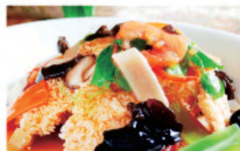
海鮮おこげ 海鲜锅巴 Seafood Guoba ¥2,500