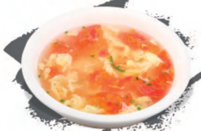
トマトと卵のスープ西 西红柿蛋花汤 Tomato Egg & vegetable soup ¥1,500