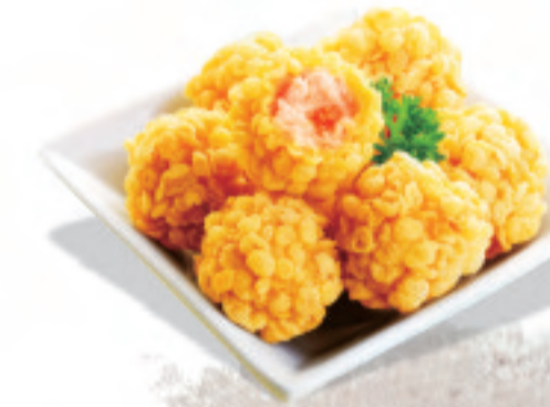
エビ団子の揚げもの 炸虾球 Fried shrimp balls ¥980