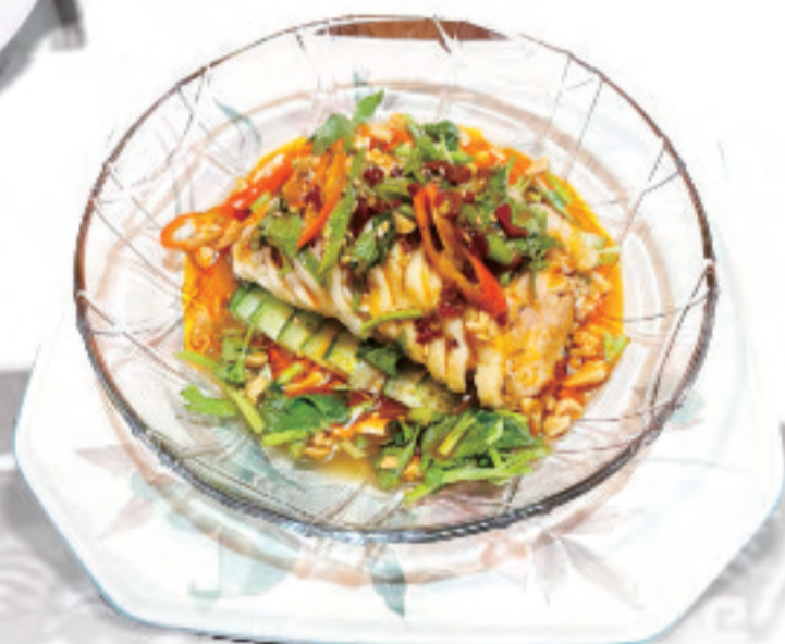
よだれ鶏 ¥1,650 口水鸡 Drool chicken