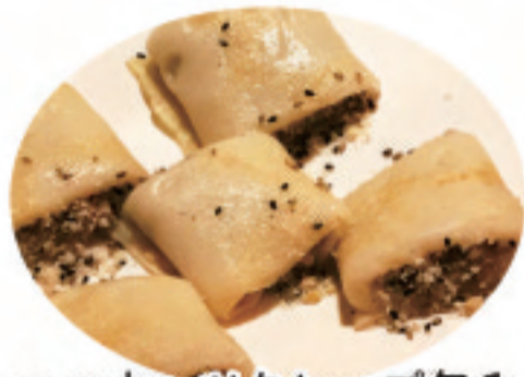
ココナッツクレープ包み 家乡甜薄饼 Hometown Sweet Pancake ¥980