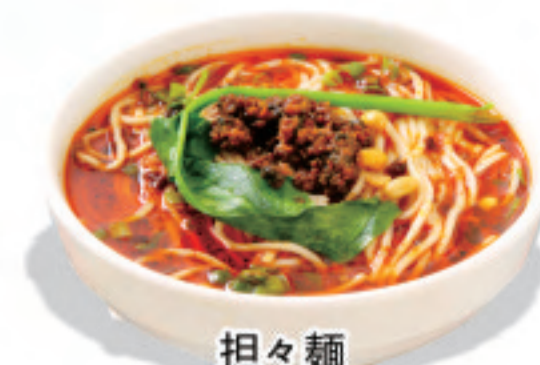
担々麵 担担面 Dandan noodles ¥1,380