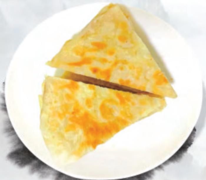
点心チチミ ¥980 天津饼 Tianjin Cake