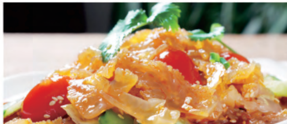
クラゲの和えもの ¥1,500 凉拌海蜇皮 Jelly fish