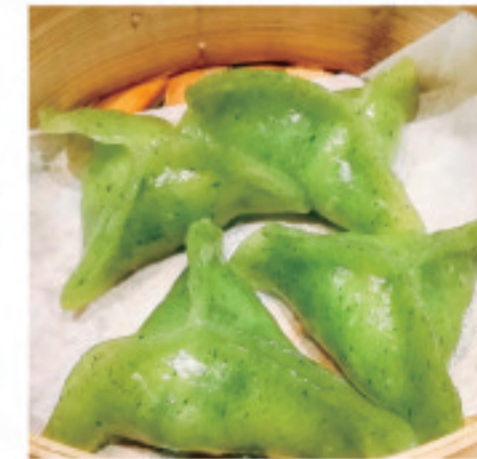
翡翠三角包 翡翠三角包 Jade Triangle Bag ¥980