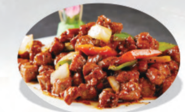
牛肉の黒胡椒炒め 黒椒炒牛肉 Fried Beef with Black Pepper ¥2,000

※表示価格は税込価格です！ ※写真はイメージで、分量など実際と異なる場合があります。 *表示价格为含税价格 *菜品图片仅供点菜参考，出品以实物为准。