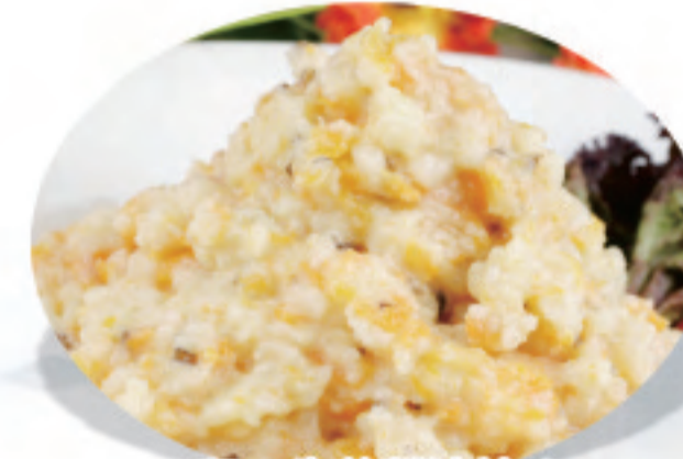
卵の生姜醤油炒め 上海風炒蟹粉 Shanghai style fried crab meat ¥1,500