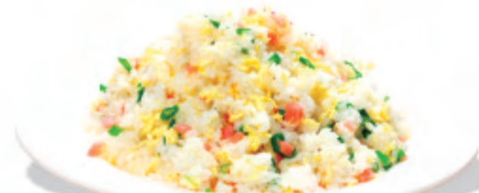
五目チャーハン 五目炒饭 Wumu Fried Rice ¥1,380