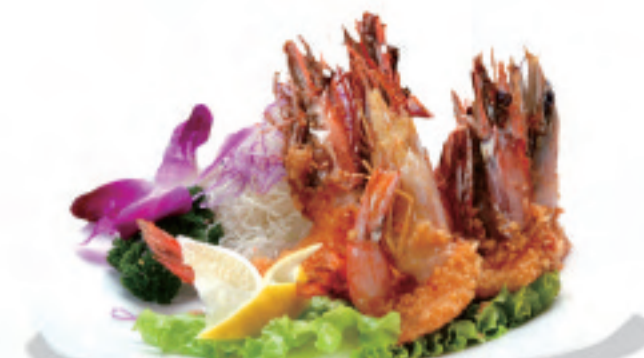
車エビの香り揚げ(5ヶ) 避风塘大虾 (5个) Typhoon Shelter Shrimp (5 pieces) ¥2,000