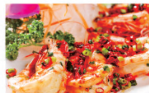
車エビのピリ辛炒め 椒盐大虾 Spicy and Salted Prawns ¥2,000