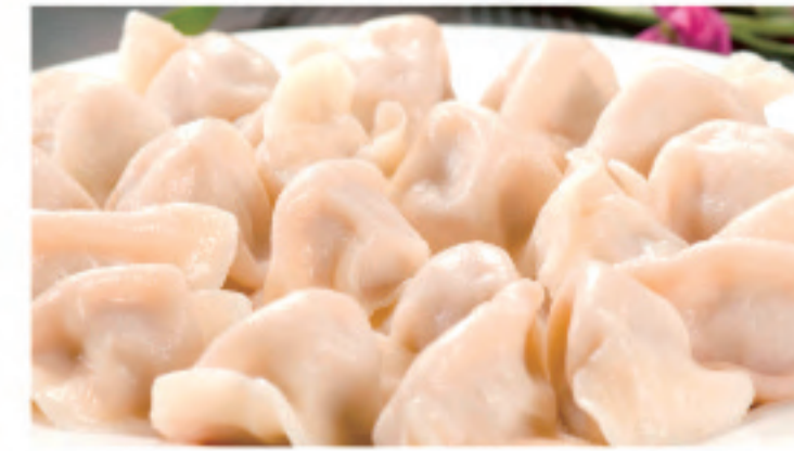
水餃子 三鲜水饺 Three Fresh Dumplings ¥980

ストップ！20歳未満飲酒・飲酒運転。 妊娠中や授乳期の飲酒はやめましょう。 *日本の法定飲酒年齢は二十歳。同時酒后 驾车属于犯罪行为。孕期哺乳期请不要喝酒。 适量饮酒要牢记。