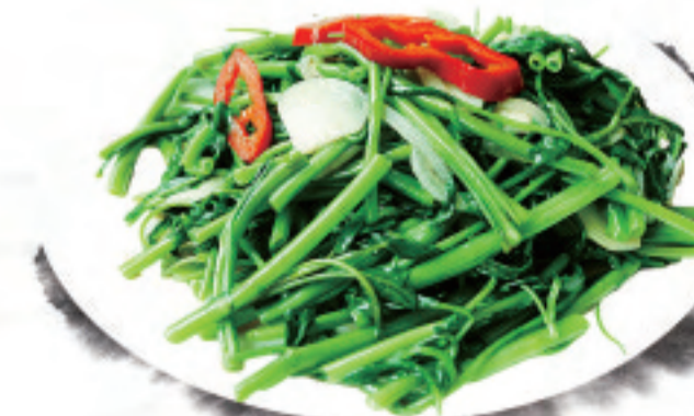
空芯菜とにんにくの炒めもの ¥1,800 蒜蓉炒空心菜 Stir fried water spinach with minced garlic

※表示価格は税込価格です！ ※写真はイメージで、分量など実際と異なる場合があります。 *表示价格为含税价格 *菜品图片仅供点菜参考，出品以实物为准。