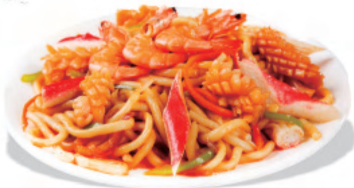
香港樓風焼きそば ¥1,500 港式炒面 Hong Kong style fried noodles