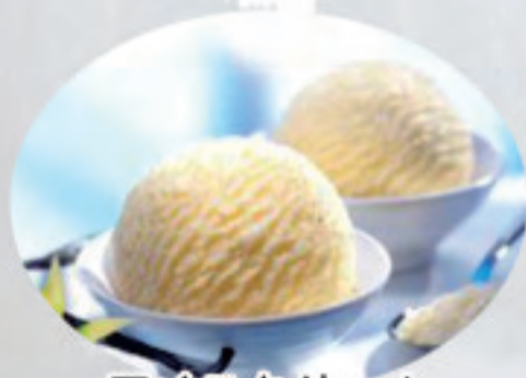
アイスクリーム 冰淇淋 Ice cream ¥680