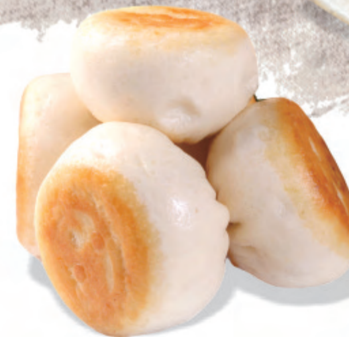
焼小籠包 ¥980 生煎包 Fried Bun

※表示価格は税込価格です! ※写真はイメージで、分量など実際と異なる場合があります *表示价格为含税价格 *菜品图片仅供点菜参考, 出品以实物为准。