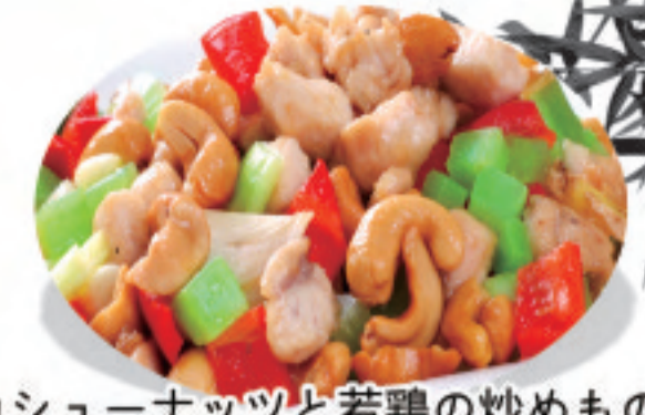
カシューナッツと若鶏の炒めもの腰 腰果鸡丁 Chicken diced with cashew nuts ¥1,800