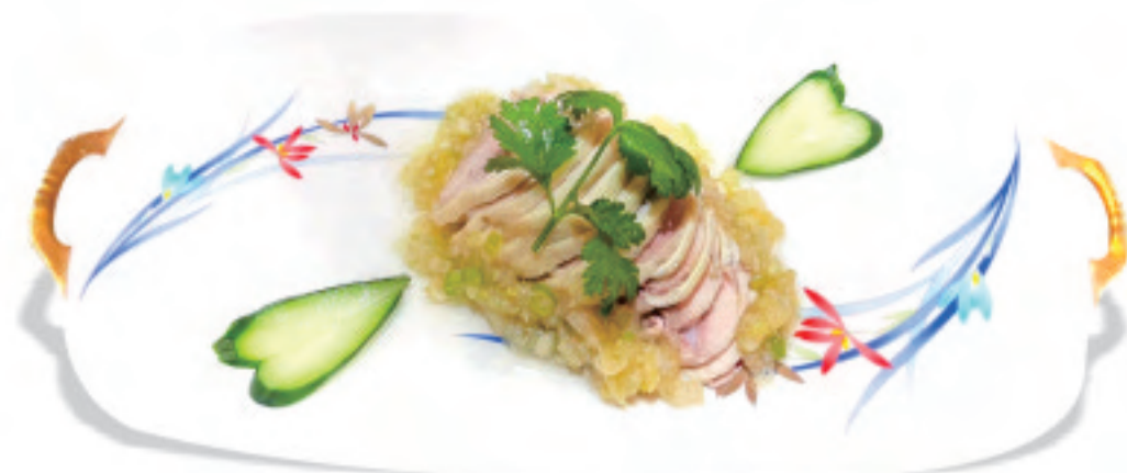
蒸し鶏の広東風 ¥1,650 白切鸡 White cut chicken