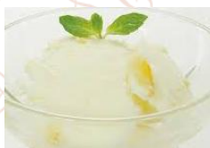
ゆずシャーベット