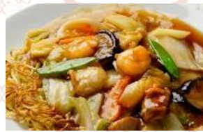
海鮮野菜の皿うどん