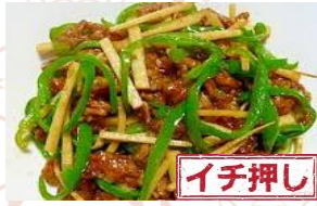
チンジャオロース