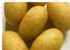
もち米の 揚げ餃子