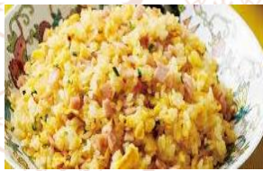
福建風具だくさん チャーハン