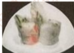
海鮮と野菜の春巻き