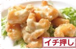
海老のマヨネーズ