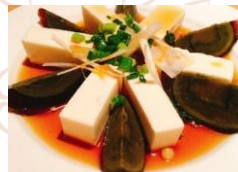
ピータン豆腐のゴマ風味