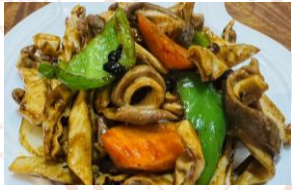
豚ハチノス 豆豉炒め