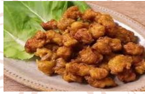
秘伝味の なんこつ唐揚げ