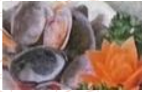
アサリとネギの 大蒜ピリ辛炒め