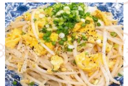
もやしの玉子炒め