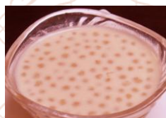
ココナッツミルク のタピオカ