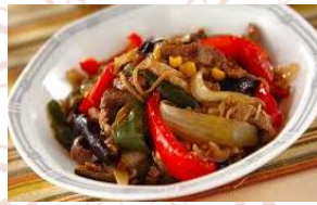
牛肉オイスター 香り炒め