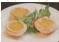
香港エッグタルト